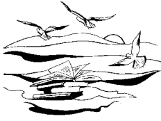
Biblioteca Comunale "Luca Orciari" Marzocca di Senigallia (AN)