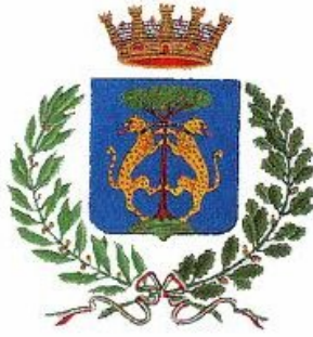
Comune di Senigallia